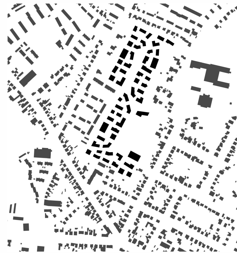
Schwarzplan M 1:2000