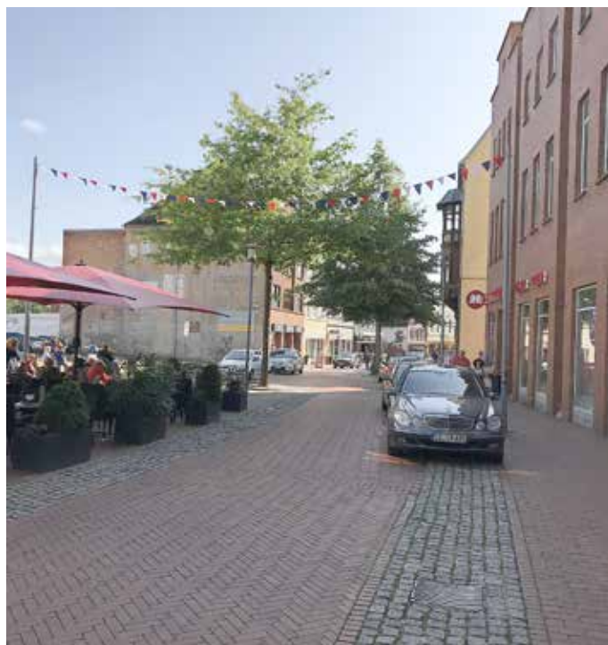
Einzelhandelsstandort: Die Gewerbesteuer ist die wichtigste Einnahmequelle der Stadt.