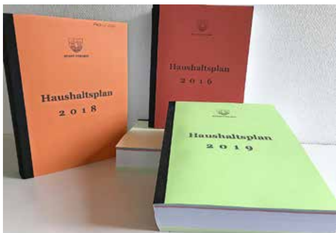
Wiegt schwer in jeder Hinsicht: Der Haushaltsplan zeigt den finanziellen Handlungsrahmen auf.