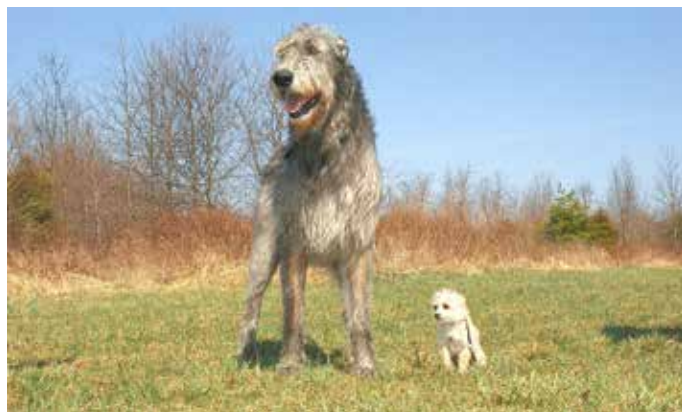
Hundesteuer: Die Größe des Hundes ist bei der Steuer nicht ausschlaggebend, sie wird pro Tier erhoben.

Jahresabschluss: Er enthält einen Lagebericht, der ein Bild der Vermögens- und Schuldenlage der Gemeinde vermittelt.