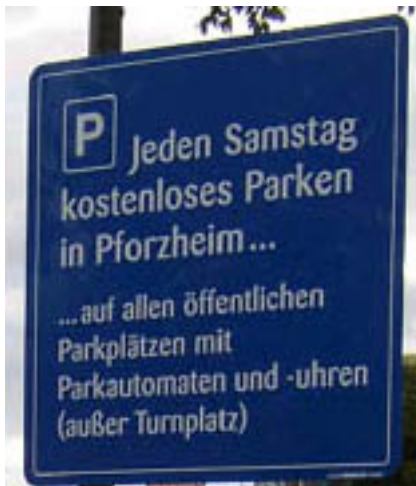
Beispiel Beschilderung aus Pforzheim

Da bereits Ende der 1990er Jahre diverse Städte aus Stadtmarketingüberlegungen und zur aktiven Wirtschaftsförderung kostenloses Parken in ihrem Einzugsbereich eingeführt haben, eignet eine solche Initiative nicht für eine lang anhaltende und vor allem überregionale redaktionelle Beachtung.