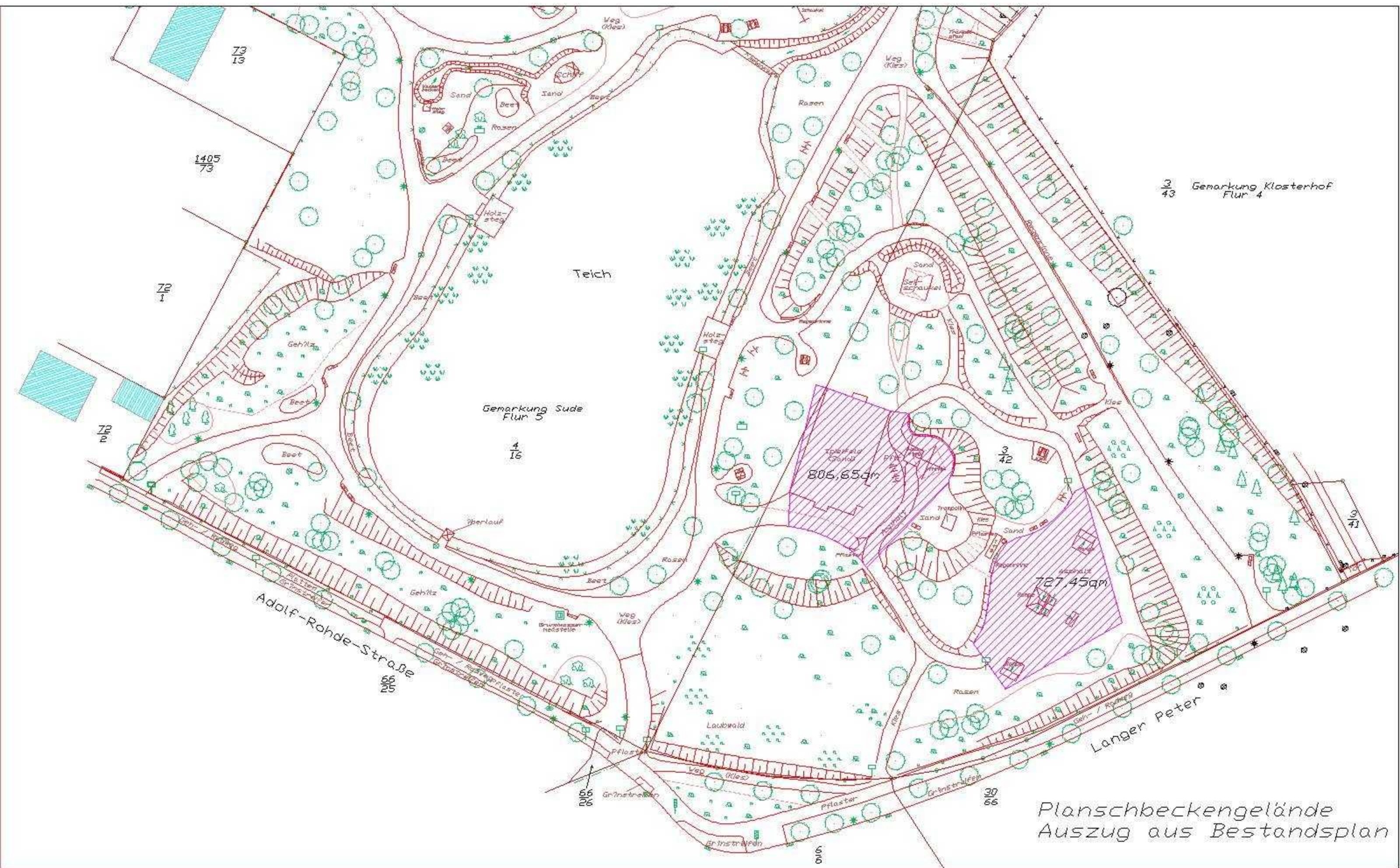
Planschbeckengelände Auszug aus Bestandsplan